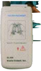
ЕКГ-ХОЛТЕР – 3 кан. “DL-820” – 2200лв.