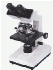
МИКРОСКОП “XSZ-107T”- 630лв.