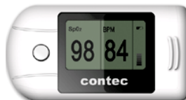
ПУЛСОКСИМЕТРИ “CMS – 50A / B” – 190 / 180лв.