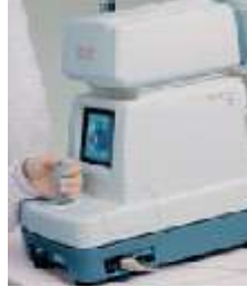
АВТОРЕФРАКТОМЕТЪР “FA-6500” – 5400лв.