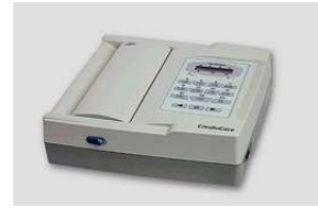
ЕЛЕКТРОКАРДИОГРАФ 12к.- “Cardio Care 2000”-3000лв.