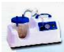
АСПИРАТОР “NEW ASPIRET” – 350лв.