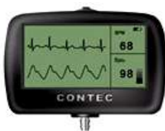
СТЕТОСКОП с ЕКГ и ПУЛСОКСИМЕТЪР “CMS-M” – 540лв.