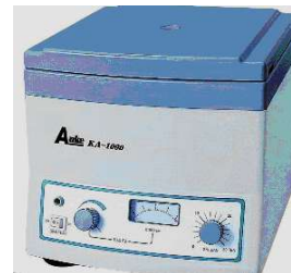
ЦЕНТРОФУГА “КА-1000” – 580лв.