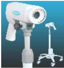
ВИДЕОКОЛПОСКОП “SLV-101” - 4900лв.