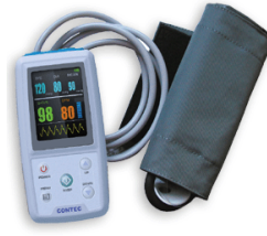
НИВР-ХОЛТЕР “CMS-06” – 2200лв.