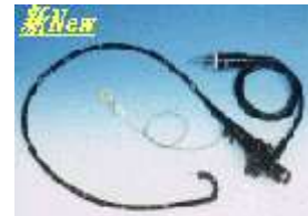
ФИБРОЕНДОСКОПИ – от 8500лв.