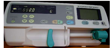
ИНФУЗОМАТ “WZ-50-C6T” –1100 лв.